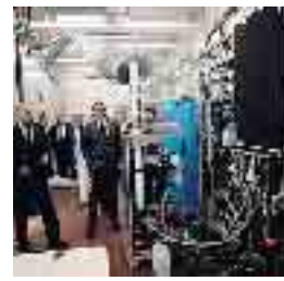
Il Musp, laboratorio macchine utensili

I SOGGETTI La ricerca su innovazione e formazione a Piacenza è stata svolta dall'Istituto Trasporti e Logistica, Fondazione Istituto sui Trasporti e la Logistica dell'Università Cattolica, Dieses. Sostegni da Piacenza Intermodale, Politecnica, Ambiter e Sbg.