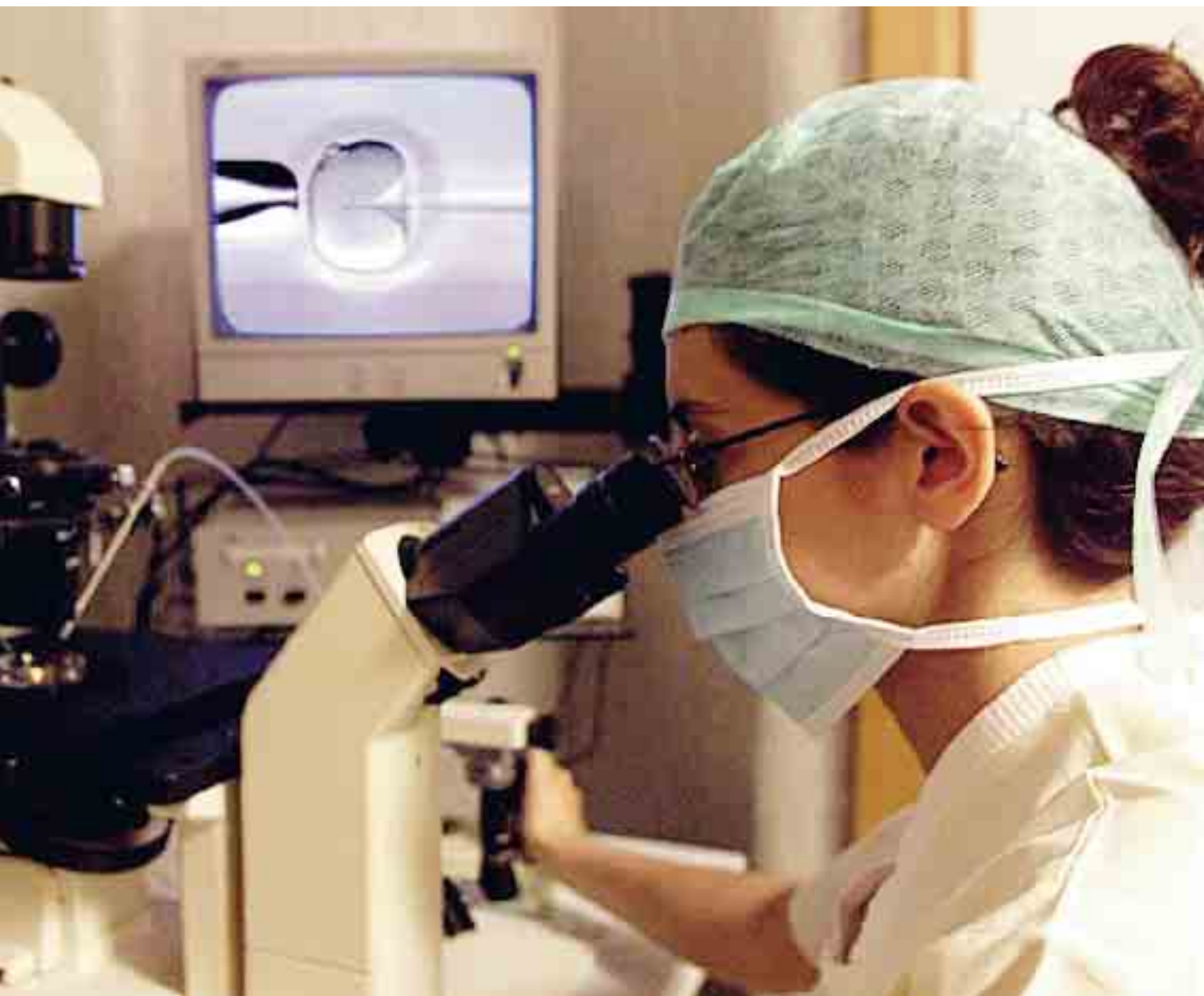
Piacenza vanta 43 laboratori dove operano i ricercatori, sono molteplici i campi di attività