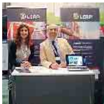
Una presentazione pubblica di Leap

Talento, tecnologia e tolleranza. Nella miscela di questi tre elementi c'è il segreto che permette alle città di decollare. E' quanto sostiene l'economista Richard Florida. Timpano riprende l'indicatore e una ricerca progressiva dove Piacenza, nel 2005, si piazzava al 19 posto in Italia (su dati Anni 90) guadagnando il 21° posto per il talento, il 38° per la tecnologia e il 25° per la tolleranza. Nell'insieme però, un tiepido 44° posto per la classe creativa. Niente di che. Oggi la ricerca di Timpano rilancia questo approccio delle tre T che rimandano alla capacità di accettare le diversità per calamitare i talenti, miscelando cultura umanistica e web. Lo sforzo culturale in senso lato è quello di formare una nuova classe media urbana - riassume l'assessore Pierangelo Carbone - così da garantire un certo tipo di sviluppo senza rischiare di rimanere al palo, emblematico è il caso di Torino che nel timore di veder e-