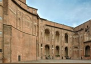
Palazzo Farnese cortile