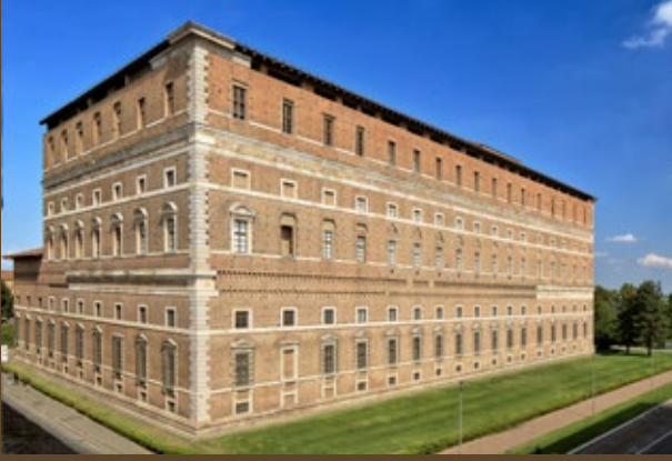
Palazzo Farnese esterno